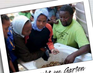
Unterricht im Garten

Der Freiwilligendienst findet im Rahmen des weltwärts-Programms des Bundesministeriums für wirtschaftliche Zusammenarbeit und Entwicklung (BMZ) statt und wird von diesem gefördert.