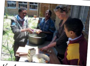
Vorbereitungen zum Essen